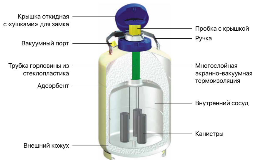
Сосуды для стационарного хранения