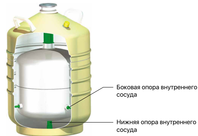
Сосуды для транспортировки и хранения